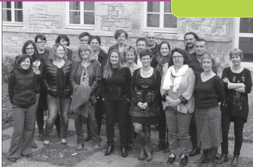
le groupe ressource

Un groupe Ressource composé d'une vingtaine de personnes d'horizons différents - Opcv, branches professionnelles, centre de ressources, institutionnels, partenaires sociaux - se réunira quatre fois par an, de 2016 à 2018.