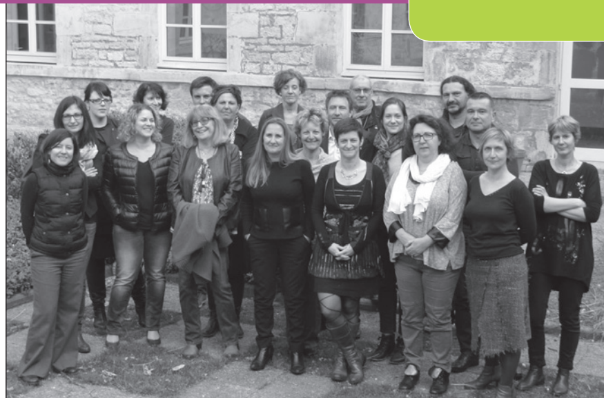
le groupe ressource

Un groupe Ressource composé d'une vingtaine de personnes d'horizons différents - Opcv, branches professionnelles, centre de ressources, institutionnels, partenaires sociaux - se réunira quatre fois par an, de 2016 à 2018.