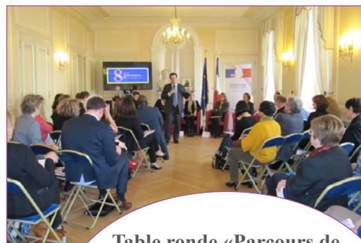
Table ronde «Parcours de femmes aux postes de décision»

Au Lycée Agricole Mancy (Lons-le-Saunier) Soirée animée par trois terminales de S.A.P.A.T - Service d'Aide à la Personne et Aux Territoires - avec la présence de membres de l'association Elles'Jura. 40 participantes