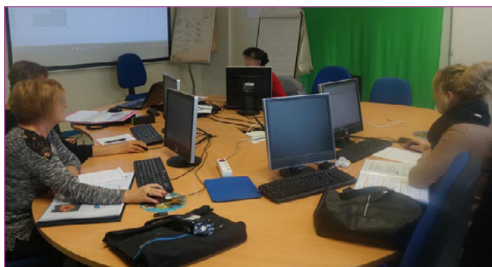
non contractuelle

L'enjeu : favoriser l'accès rapide à un emploi durable répondant à des besoins identifiés en amont. DIGITELLES, doit permettre à des femmes demandeuses d'emploi de booster leur recherche en acquérant des compétences transversales dans le domaine du numérique.