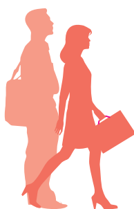
CONTRATS AIDÉS MARCHANDS