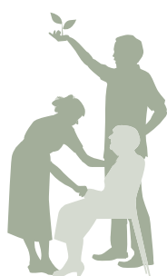
CONTRATS AIDÉS NON MARCHANDS

* Uniquement pour les individus à temps partiel. Note : résultats pondérés issus des réponses à la seconde vague d'enquête. Champ : demandeurs d'emploi qui se sont inscrits à l'ANPE au 2 e trimestre 2005 et entrés en contrat aidé entre cette date et le 2 e trimestre 2007.